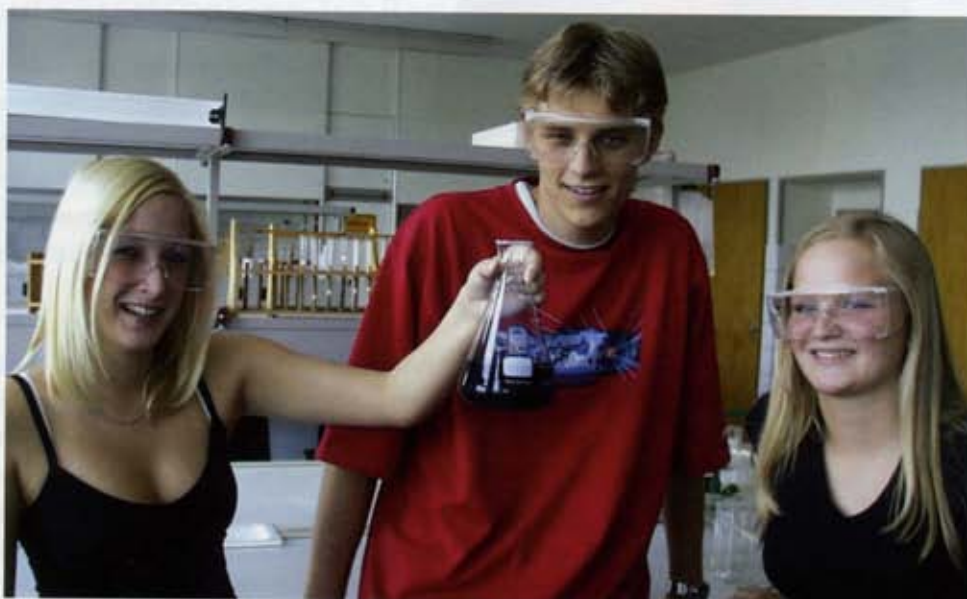
Biologieunterricht am Wirtschaftsgymnasium, Berufskolleg Dinslaken